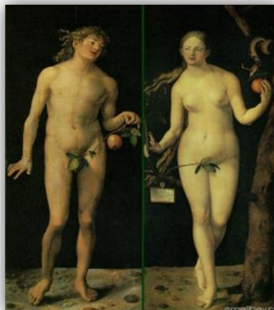
Адам и Ева