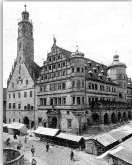
Ратуша, 1572 г. Якоб Вольф