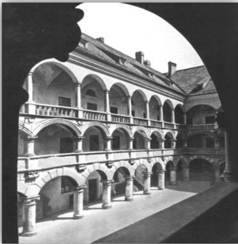
Монетный двор 1567 г.