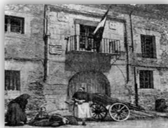
Жилой рядовой дом городского типа