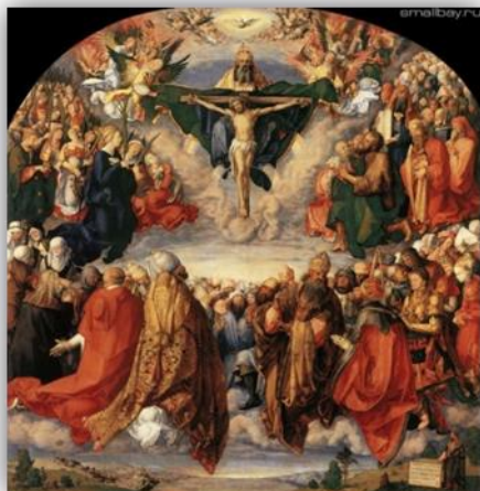
Праздник всех святых

особое внимание привлекают многочисленные автопортреты, что было необычно для искусства Возрождения.