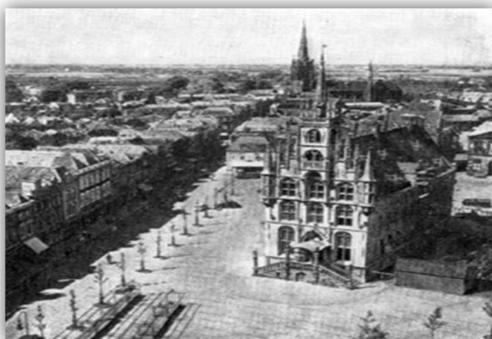
Площадь, здание ратуши